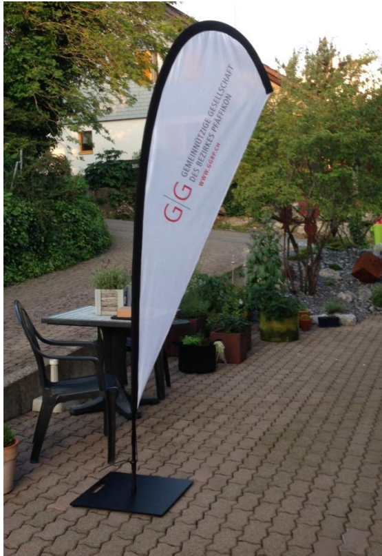
Banner mit dem neuen Logo der Gemeinnützigen Gesellschaft des Bezirkes Pfäffikon